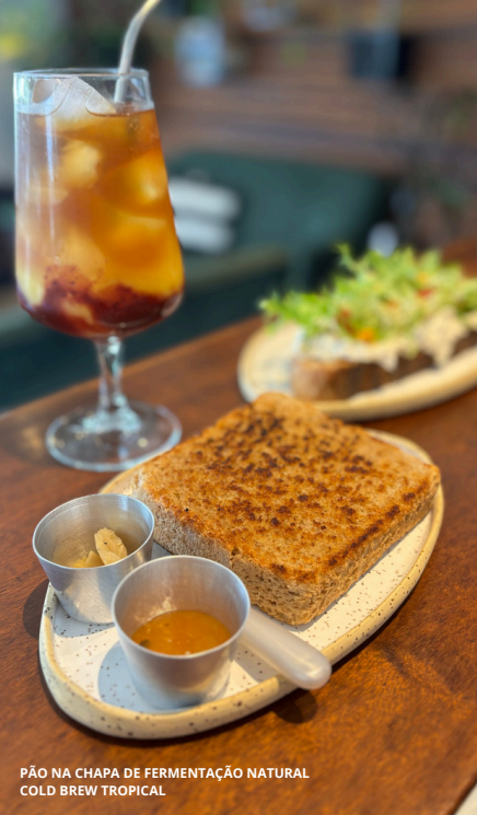
PÃO NA CHAPA DE FERMENTAÇÃO NATURAL COLD BREW TROPICAL