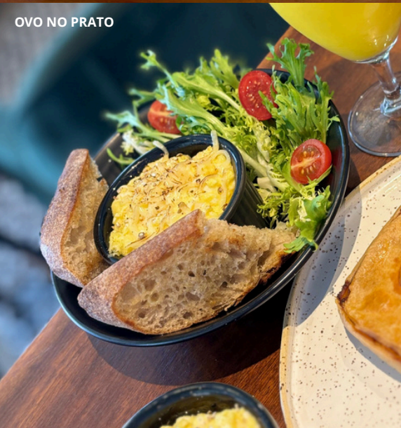
OVO NO PRATO