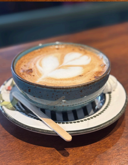
CHOCOLATE QUENTE PRETO DOCE DE LEITE QUENTE