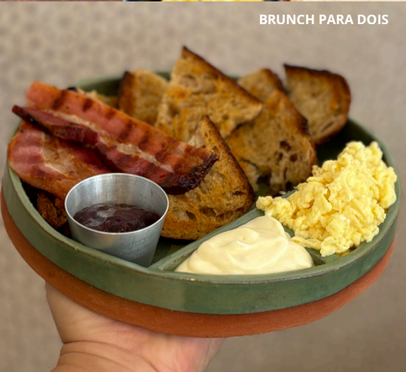
BRUNCH PARA DOIS