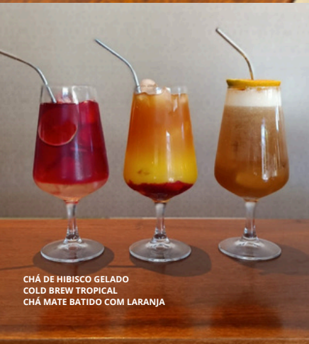
CHÁ DE HIBISCO GELADO COLD BREW TROPICAL CHÁ MATE BATIDO COM LARANJA